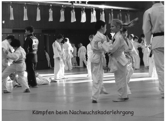
Kämpfen beim Nachwuchskaderlehrgang