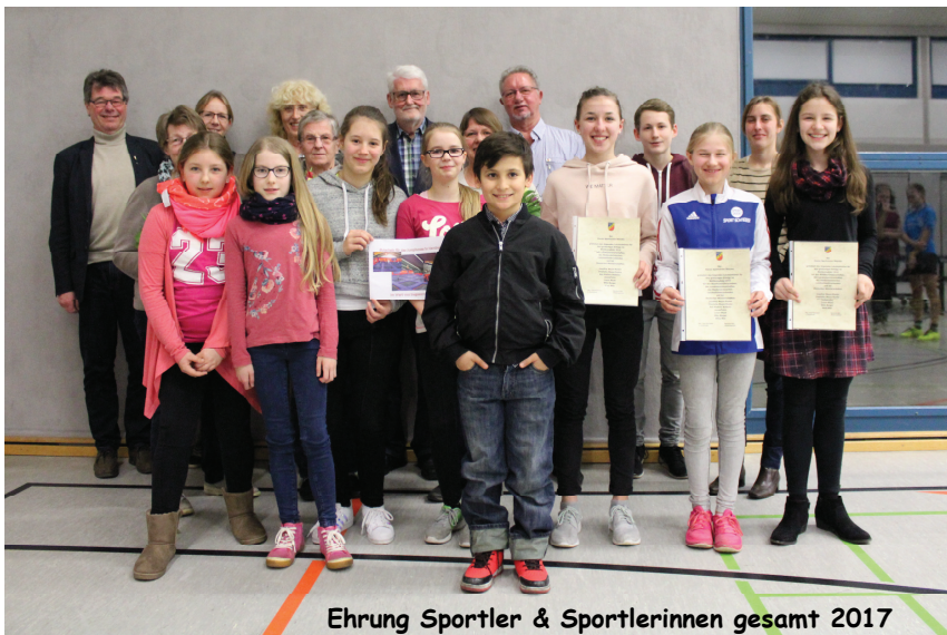
Ehrung Sportler & Sportlerinnen gesamt 2017