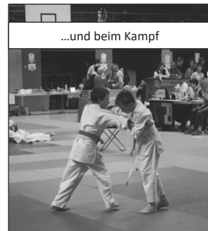
...und beim Kampf

Teilnehmern besetzen Gewichtsklassen dieses Mal nicht ganz für das Podest.