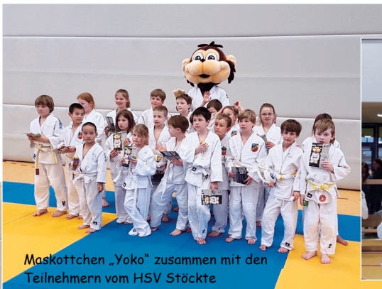
Maskottchen „Yoko“ zusammen mit den Teilnehmern vom HSV Stöckte