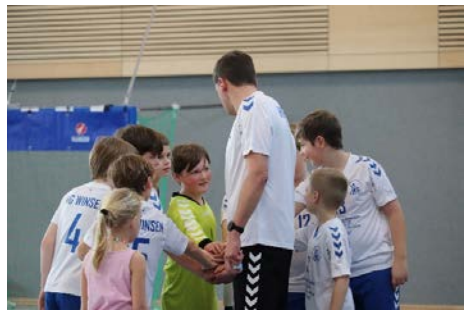
Ritual vor jedem Spiel, der Trainer schwört das Team kurz vor Anpfiff nochmal ein.