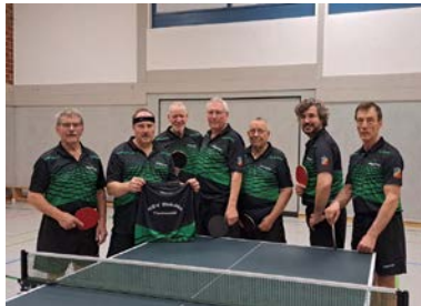
Ein Teil der Mannschaft