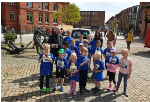
Die jüngsten Läufer vom 39. Deichlauf

Das Anmeldeformular zeigt alle Laufmöglichkeiten an.