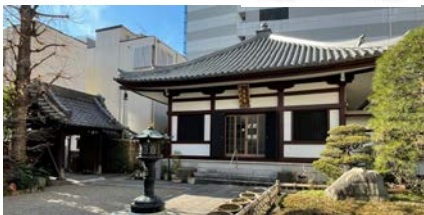
Ursprünglicher Ort des Kodokan: Hier wurde der Judo sport geboren.